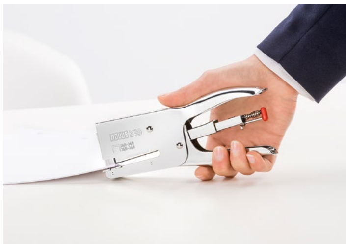
De klassieke standaard kantorniettang met robuuste techniek