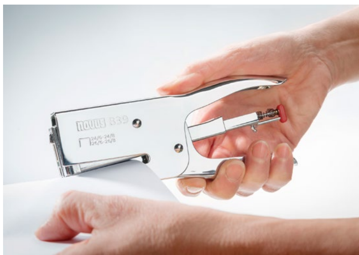
Praktische niettang met grote inlegdiepte en geschikt voor vele toepassingen