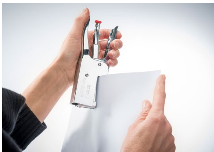
Stabiele niettang met ergonomisch design