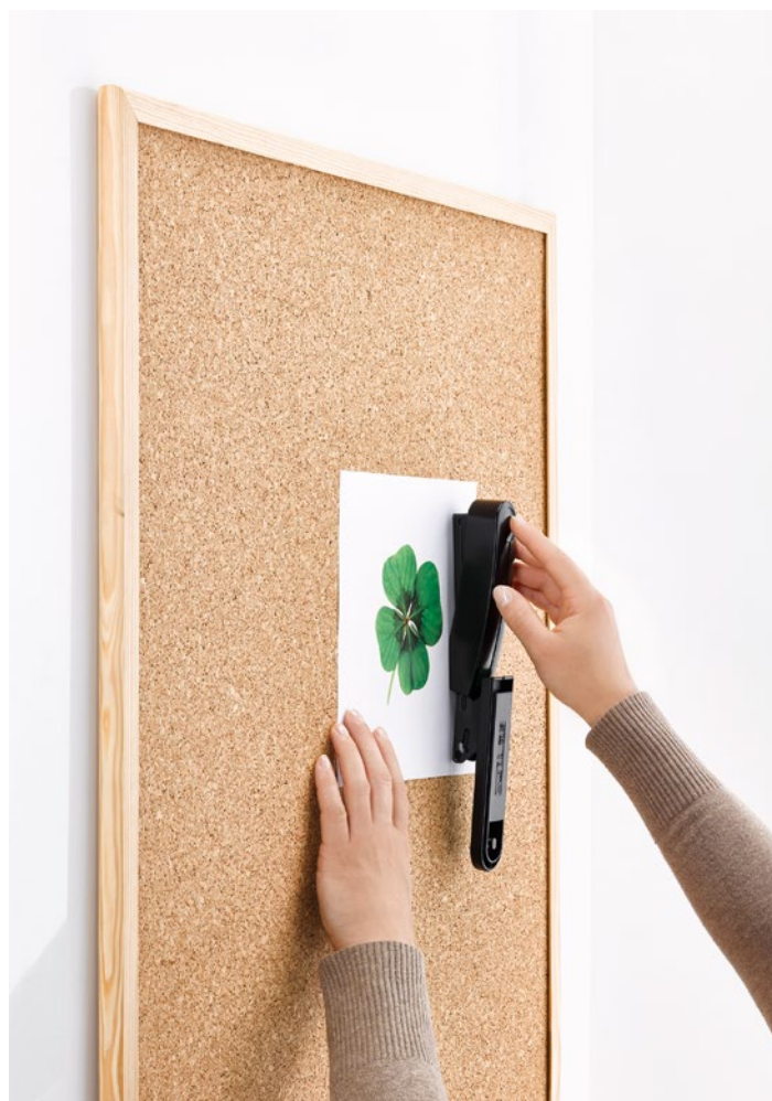
De mogelijke nietwijze: