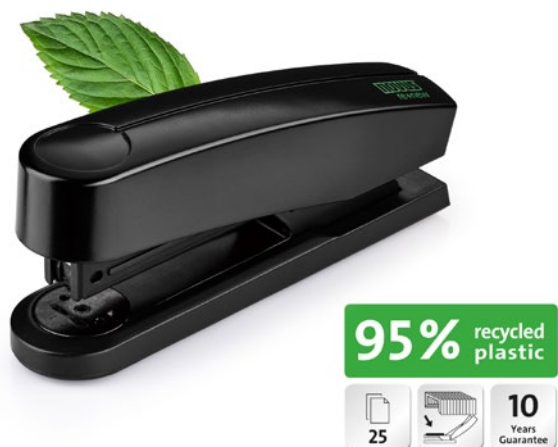
Novus B 2 re+new met pictogrammen