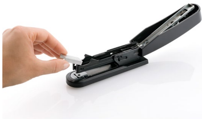
Bovenlaadmechanisme met enkele nietjesgeleiding